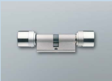
Digitaler Schließzylinder mit Tastersteuerung

Schließzylinder mit gekapselter Elektronikbaugruppe zum Einbau in Türen nach DIN 18250 mit Europrofilenschlössern nach DIN 18251. Er wertet die Funksignale von Transpondern aus und entscheidet, ob eine Zugangsberechtigung besteht.