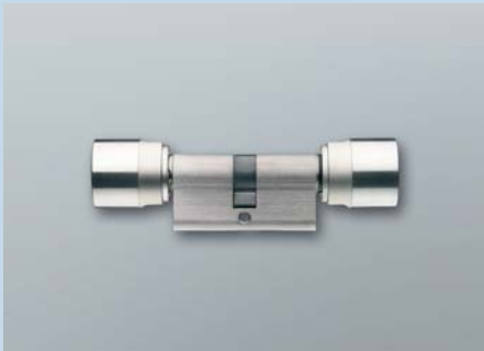
Digitaler Schließzylinder 3061