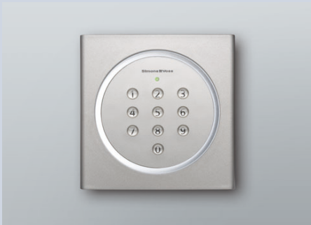
Verkabelungsfreie PinCode-Tastatur 3068