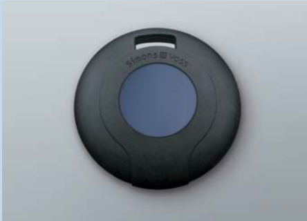
Lifestyle-Transponder 3064 – Standardversion mit nachtblauem Taster